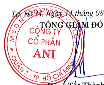
Đặng Tất Thành